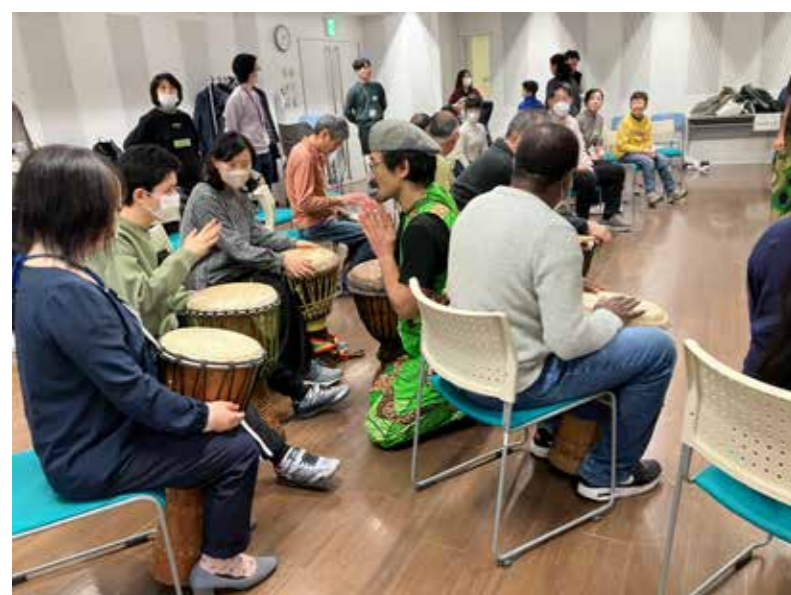
ミンナシテジャンベール