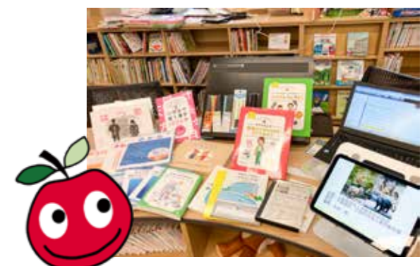
「りんごの棚」ロゴマーク