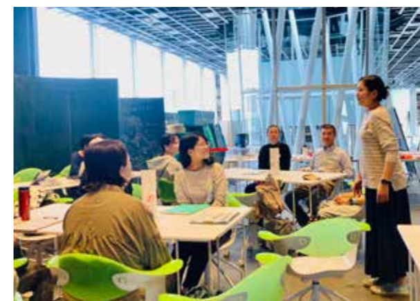
スウプノアカデミア「ストレス・疲れを軽くしよう！わたしたちのコーピング」

普段はあまり障害のある方と会う機会がないけど、同じく共感できることがあったり、あらたな気付きをもらったり、幅広い面で勉強できました。