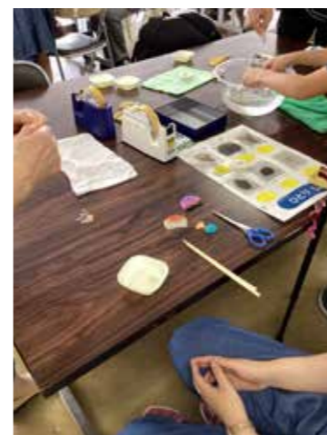
ミンナシテタメスカガーク