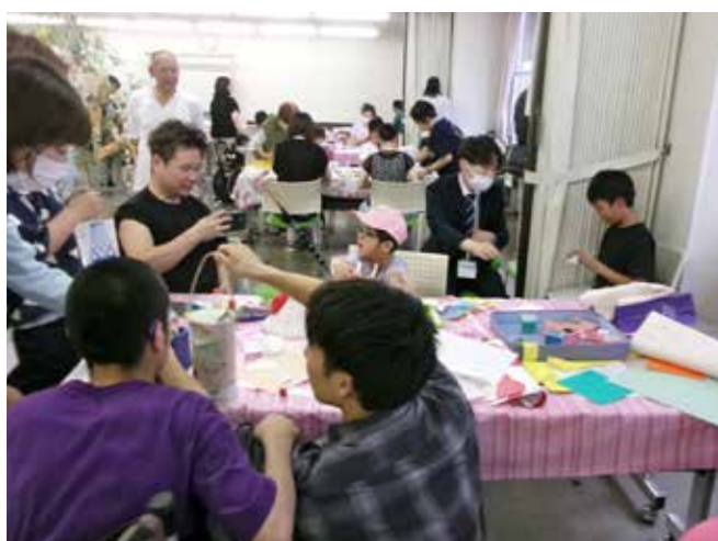
ミンナシテツクール