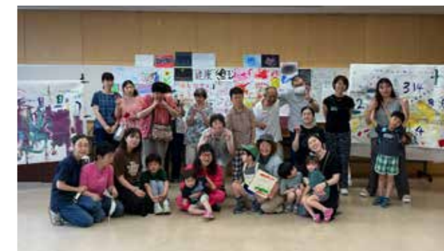
ミンナシテイロドール

自由楽しく活動できました。いろいろな画材を試し、絵にあまり興味なかった息子もお気に入りの作品ができたようで、母としてとても嬉しいです。ありがとうございました。