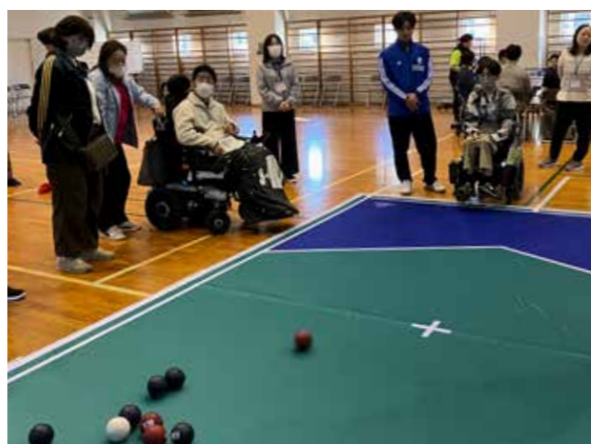
ミンナシテスポーツ