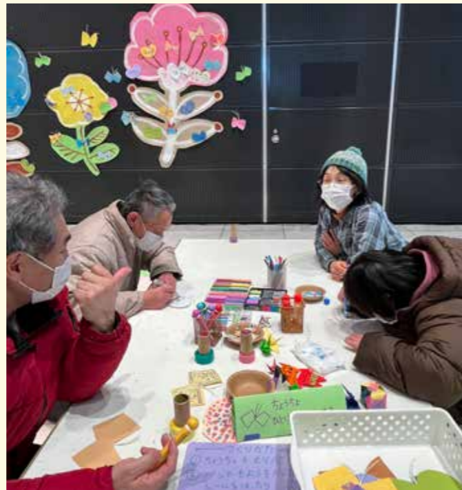
◀ 会場の後方に設置した「あそびの広場」