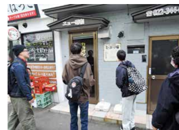
スウプノアカデミア「新発見・再発見！北仙台を気ままに散歩」

私自身が人とのコミュニケーションが得意ではなく、他の人と関わる練習として、ボランティアに応募しました。