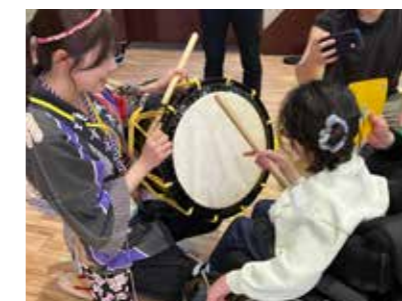
ミンナシテスズメデツナガール