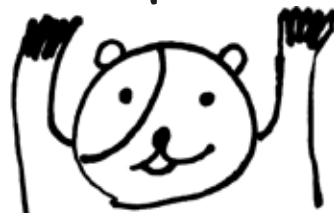
イラスト：はるかさん