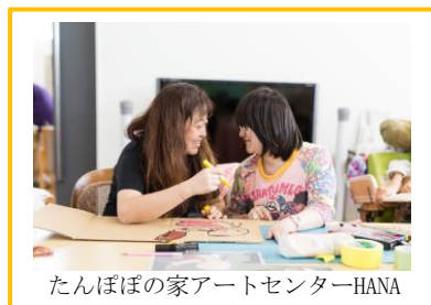
たんぼぼの家アートセンターHANA