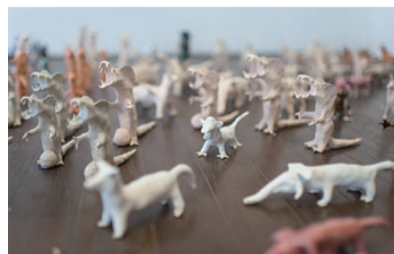
2015年いしのまきのアート展の様子