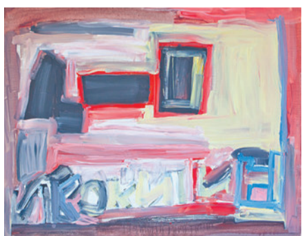
片寄大介 (w910×h720mm、キャンバス・アクリル絵の具、2016年)