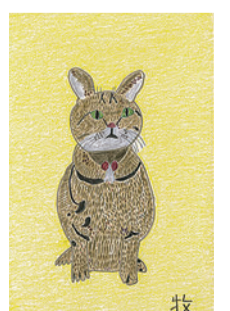
牧稔「ねこ」 (w270×h400mm、紙、ペン、クレヨン、2016年)